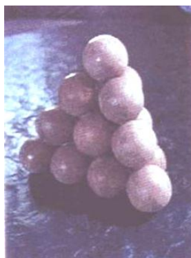
Abbildung 2. Beispielbild aus dem Math-WALK von Luckmann (2003)

Die Schülerinnen und Schüler mussten folgende Aufgabenstellung ausarbeiten: „Schreibe alle Wörter, Nummern, Formen und arithmetische Probleme auf, welche dir zu dem Bild einfallen.“